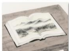
022-天地物书页山水画.jpg